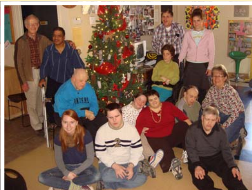
On dirait que les clients du service de répit et le personnel, qui venaient de terminer la décoration du sapin, attendaient le père Noël. Et ils ne furent pas déçus! Cette année, le gros bonhomme est arrivé lors d'une journée de répit, après le dîner de Noël, et il a distribué ses cadeaux dans un tonnerre de Ho! Ho! Ho!